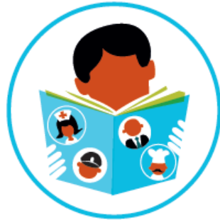
leren en werken